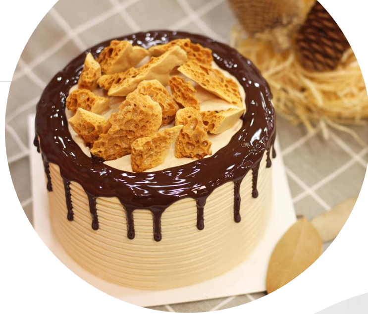
[Vegan] Caramel Drip Cake