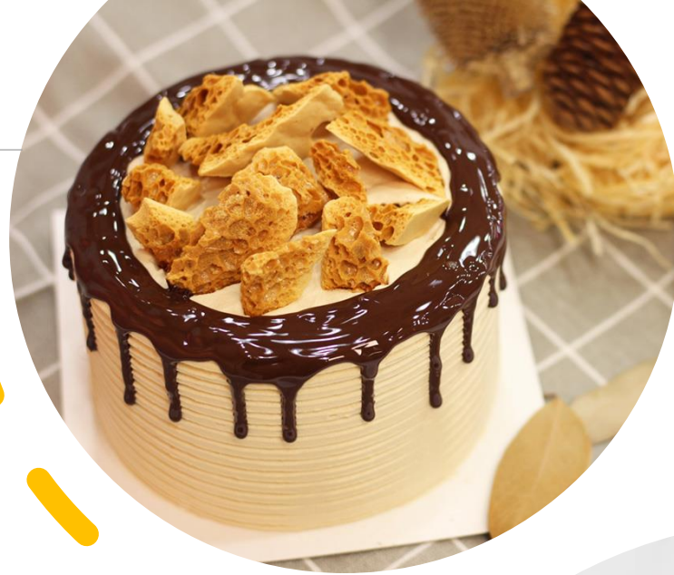
[Vegan] Caramel Drip Cake