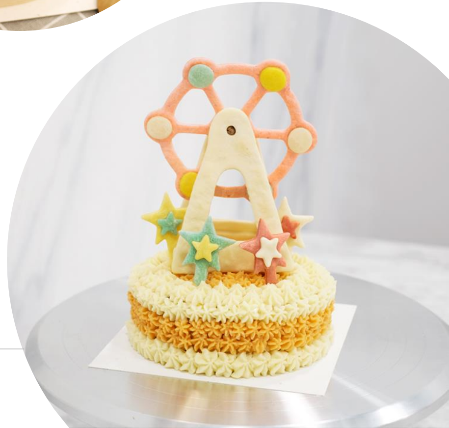
[寵物系列] 幸福摩天輪

Other than seasonal new items, we also provide “Vegan Choices” for special needed guests and “Pet-friendly” choices.