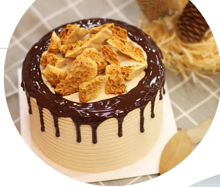
[Vegan] Caramel Drip Cake